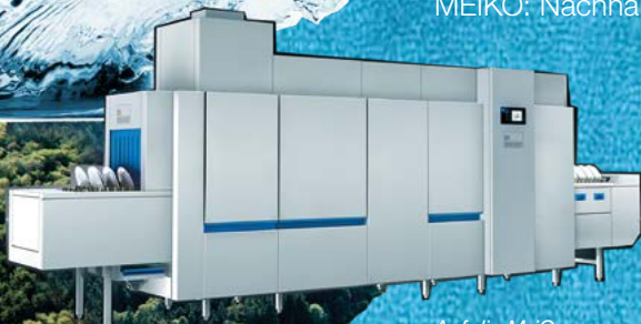
Auf die M-iQ