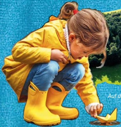
Auf die Kinder