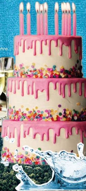
Auf die nächsten 10 Jahre